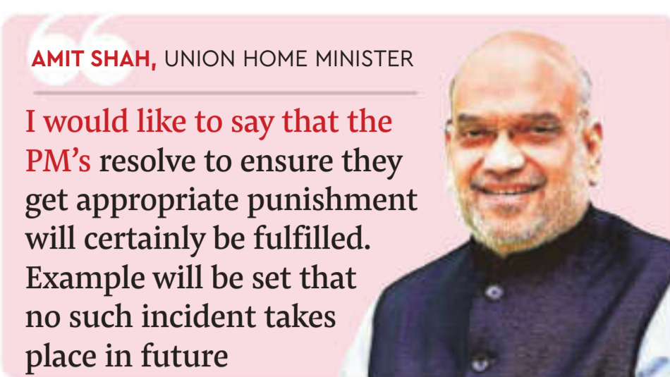
AMIT SHAH , UNION HOME MINISTER

"The entire world has accepted India's fight against terrorism in the last 11 years under the leadership of Narendra Modi (Prime Minister Narendra Modi). The entire world has acknowledged it and Naren-