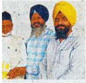
ਸਨਮਾਨਤ ਕਰਦੇ ਹੋਏ

ਏਸ਼ਾ ਬਣਦਾ ਹੈ ਕਿ 23 ਤਰੀਕ ਉੱਚ 'ਤੇ ਪ੍ਰਸਾਰਣ ਸ਼ੁਰੂ ਕਰਨ 'ਯੂ-ਟਿਊਬ ਚੈਨਲ' ਨਾਲ ਹਰ ਕੋ ਨੁਕਤੇ ਰਾਸਲ ਕੀਤੇ ਹਨ ਹੀ ਇਸ ਕਾਰਜ ਲਈ ਆਪਣੇ ਕਰਨ ਲਈ ਤਿਆਰ ਹਨ। ਨਾਲ ਹੁਣੇ ਇਸ ਮਸਲੇ ਨੂੰ ਹੱਲ ਕਰ ਕੇ ਨਿਰੋੜ ਸੰਗਤਾ ਖਿਆ ਜਾਵੇਗਾ।