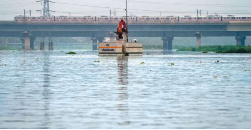
The Yamuna in New Delhi breached the danger mark of 205.33 metres on Monday evening, as levels rose to 205.4 metres after Haryana released more water into the river from the Hathnikund barrage